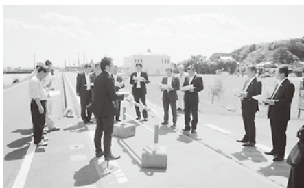
④県内調査（霞ヶ浦サイクリングロード）