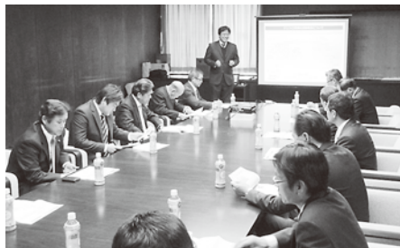
①県内調査（ジェトロ茨城）

常任委員会（総務企画）として、閉会中委員会、県内外の工場・施設等の視察を行いました。