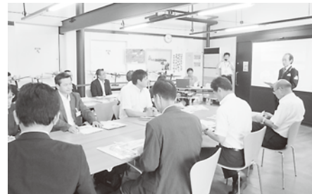
③県内調査（空の駅そらら）