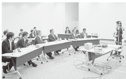
⑤県内調査（サイバーデザイン社）